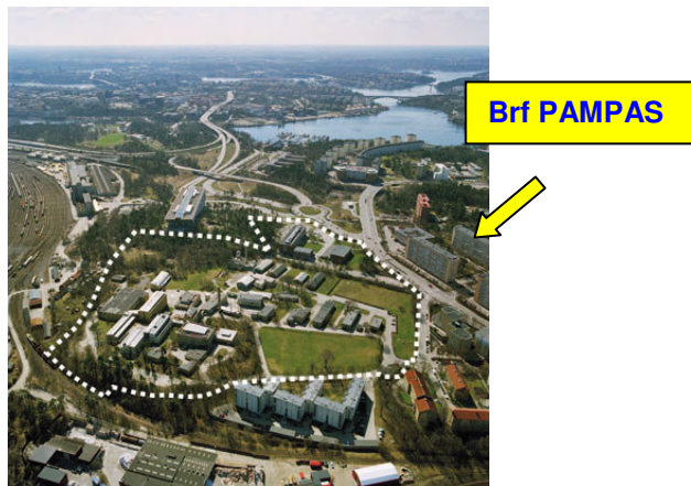
Flygbild med programområde

SBL-området i Huvudsta ses som ett av landets viktigaste byggnadsverk från den modernistiska epoken. Här planeras nu för nya bostäder och kontor kring den kulturhistoriska miljön. Ca 650 lägenheter och ca 40 000 m 2 kontorslokaler bedöms kunna tillkomma. Förslaget syftar till att förbättra sambanden till omgivningarna och att stärka entrén till Huvudsta och Solna.