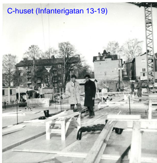
C-huset (Infanterigatan 13-19)