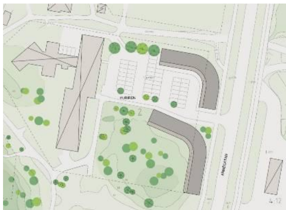
Illustrationsplan som visar byggnadernas placering

Vill du ha mer information hänvisar vi till www.solna.se