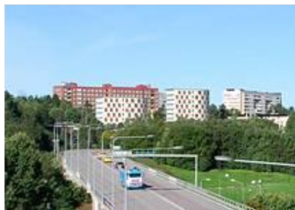
Perspektiv från E4/E20 som visar hur de nya byggnaderna kan gestaltas.

Stockholms studentbostäder planerar att bygga två nya hus med 200 studentlägenheter framför det idag befintliga studenthemmet STRIX på Armégatan 32. Den tänkta utformningen framgår att de två nedanstående bilderna.